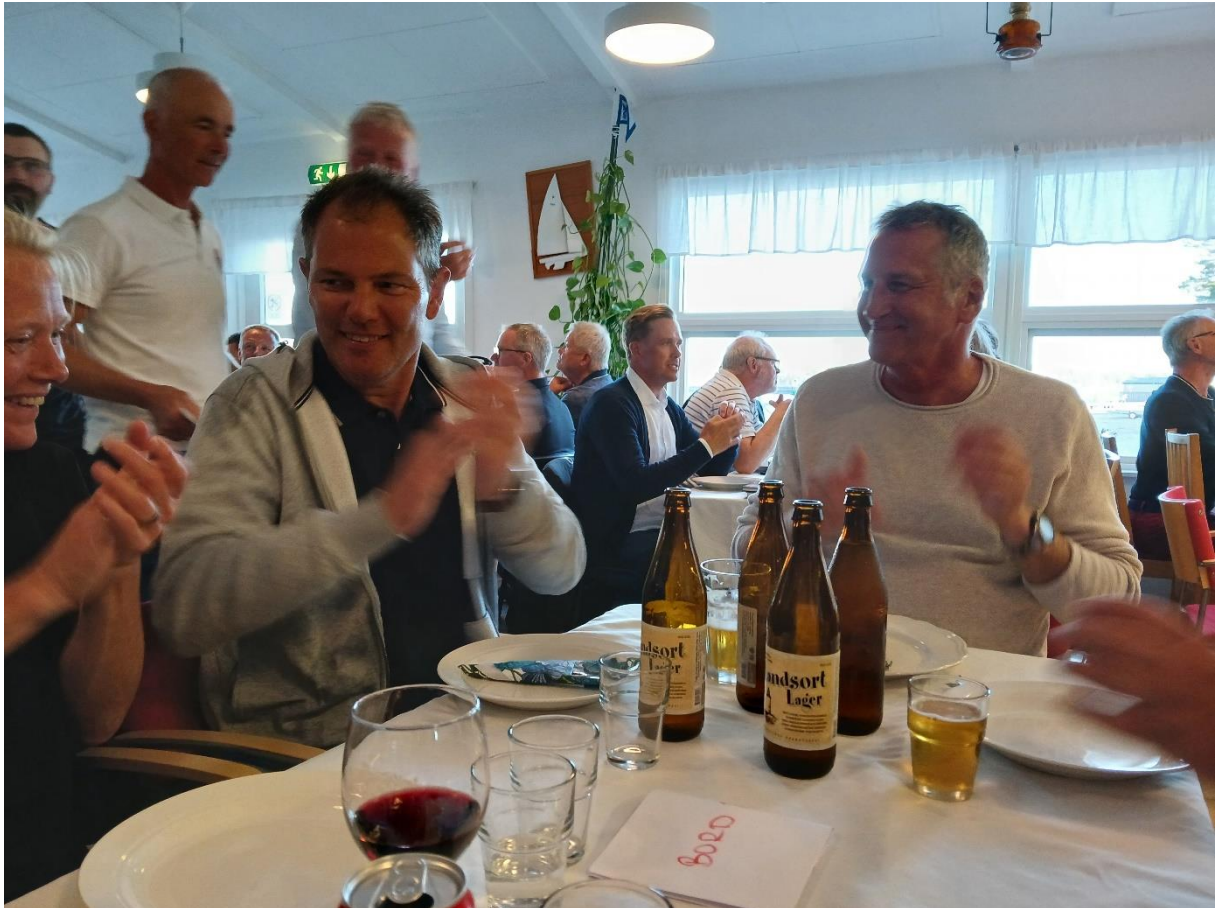
Glada vinnare vid regattamiddagen.

Seglingarna avslutades sedan med regattamiddag i klubbhuset som inte avslutades förrän de sista reglarna blev "utslängda" vid 12-tiden på natten.