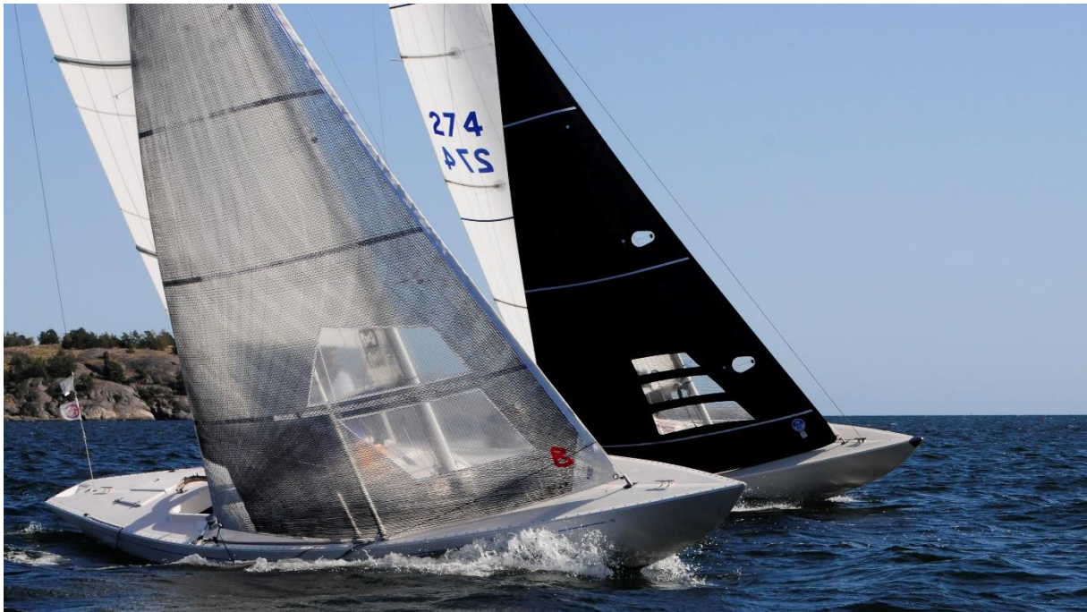
Holmlund/Axelsson fortsatte att segla stabilt och vann även segling 5.