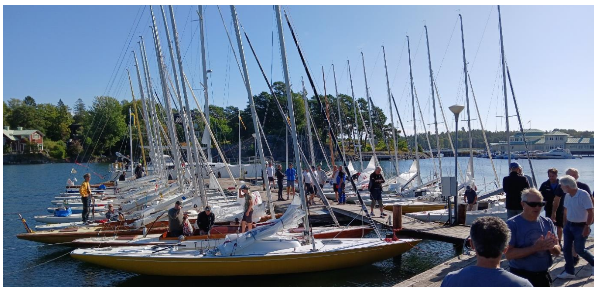
24 Neppare vid samma brygga!