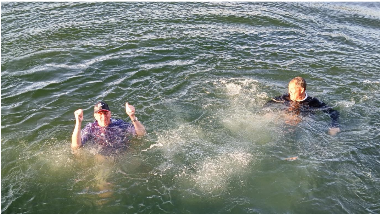
Traditionsenligt slängdes sen vinnarna i sjön.